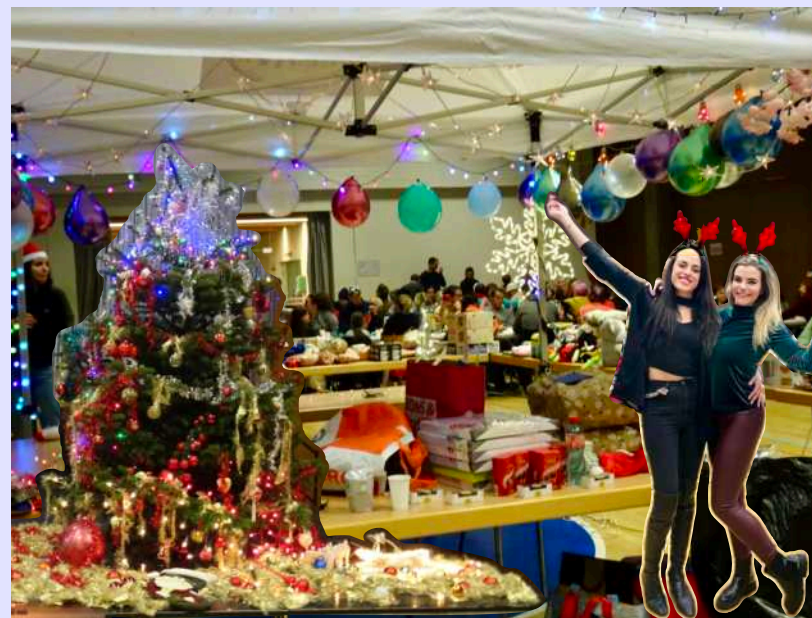
24 déc. - Repas de Noël, salle communale des Asters. Repas et cadeaux.