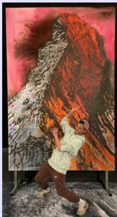
Expo « Tout contre la Terre », Muséum de Genève, 21 mars.