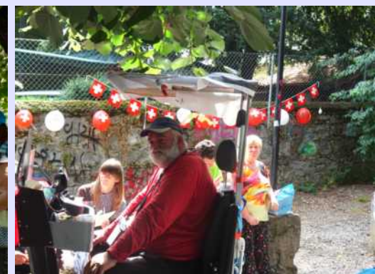
1er Août, fête nationale : grillades au parc Galiffe.