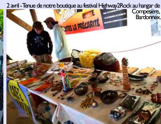
2 avril - Tenue de notre boutique au festival Highway2Rock au hangar de Compsière, Bardonnex.