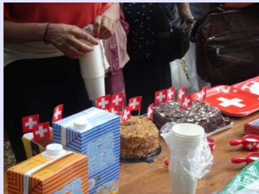
1er Août, fête nationale : grillades au parc Galiffe.

Des fêtes, des repas, des célébrations sont organisés plusieurs fois par année, en plein air. L'occasion de manger ensemble à table, de partager de bons moments et consolider les liens. Ces fêtes sont aussi l'occasion de commémorer les événements festifs et plus solennels qui ponctuent notre vie, et pour certains bénéficiaires de participer à l'organisation de l'évènement et de se voir ainsi investis d'une responsabilité. Il s'agit là de petits boulots ponctuels rémunérés.