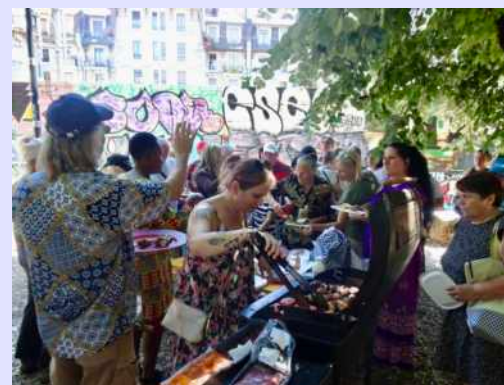
14 juillet - Grillades, au parc Galiffe.