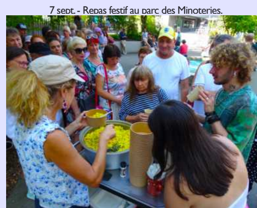
7 sept. - Repas festif au parc des Minoteries.