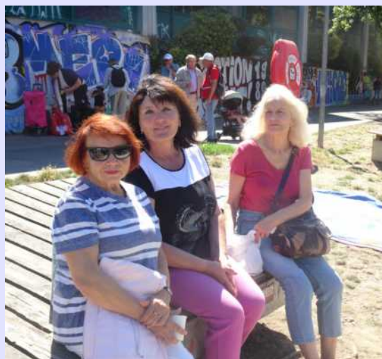
8 août - Pique-nique au bord du Rhône lors de la canicule...