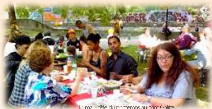
13 mai - fête du printemps au parc Galiffe,

Ces fêtes permettent aussi à certains bénéficiaires de participer à leur organisation et de se voir ainsi investis d'une responsabilité. Ces petits boulots ponctuels sont rémunérés.